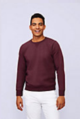
SOL'S SULLY 02990